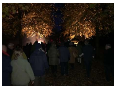
Allehelgensvandring i og omkring Selsø Slot d. 3. nov.