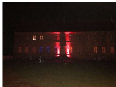
Lys på Selsø slot i forbindelse med Allehelgens vandring 3.nov.

Publikum blev mødt af musik, sang og dans, samt store flotte spillekort lavet af Billedskolen. Det var en meget stemningsfuld vandring på det halvmørke slot i skumringen. Slottet var belyst af egnsteatrets lysdesigner. Publikum mødte så talstærkt op, at vi måtte gentage enkelte scener flere gange for at få plads til publikum. Vandringen sluttede med fællessang på slottets gårdsplads.